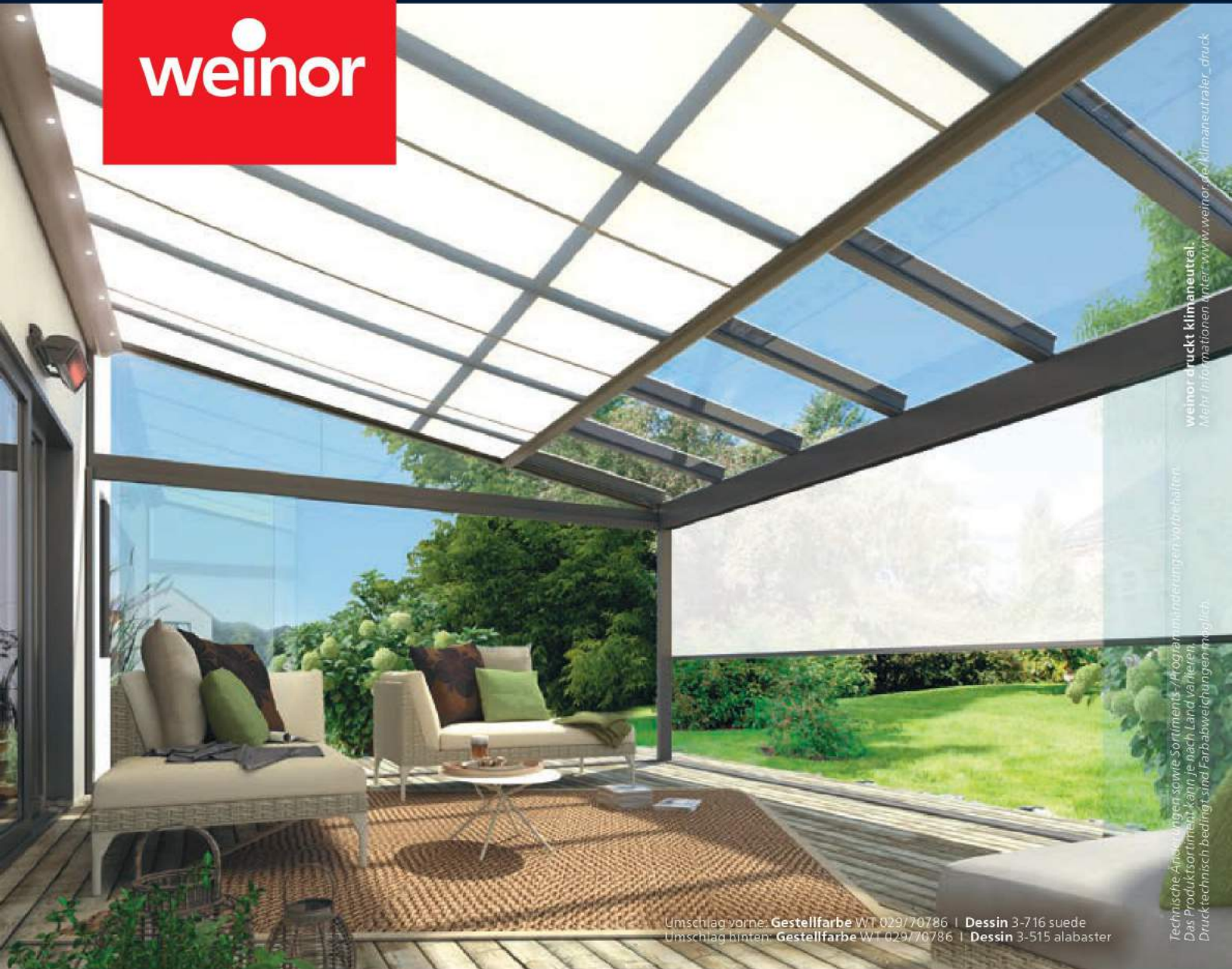
Umschlag vorne: Gestellfarbe WT 029/70786 | Dessin 3-716 suede Umschlag hinten: Gestellfarbe WT 029/70786 | Dessin 3-515 alabaster

weinor druckt klimaneutral. Mehr Informationen unter www.weinor.de/klimaneutraler_druck Technische Anpassungen sowie Sortiments-/Anlagenänderungen vorbehalten. Das Produktsortiment kann je nach Land variieren. Drucktechnisch bedingt sind Farbabweichungen möglich.