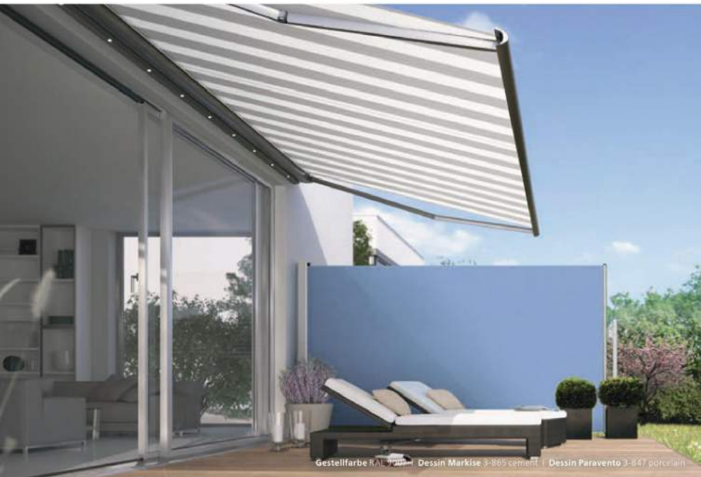
Gestellfarbe RAL 9006 | Dessin Markise 3-865 cement | Dessin Paravento 3-847 porcelain

Die stilvolle Seitenmarkise Paravento schützt vor fremden Blicken, Sonne und kühlem Seitenwind. Als kostengünstige Lösung lässt sich die schlanke, aber solide Kassette praktisch überall montieren. In Kombination mit einem topaktuellen Dessin aus der weinor Tuchkollektion setzt der Paravento attraktive Akzente.