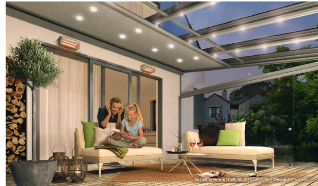
Gestellfarbe wie Titelbild: WT 020/70786 | Dessin 4-716 avante

weinor Zubehör-Lösungen werden genau wie unsere Sonnen- und Wetterschutzprodukte in eigenen Werken in Deutschland entwickelt und erstklassig verarbeitet. Strenge Kontrollen sichern die hohe Qualität. Durch die werkseigene Produktion sind alle Produkte optisch und technisch perfekt aufeinander abgestimmt.