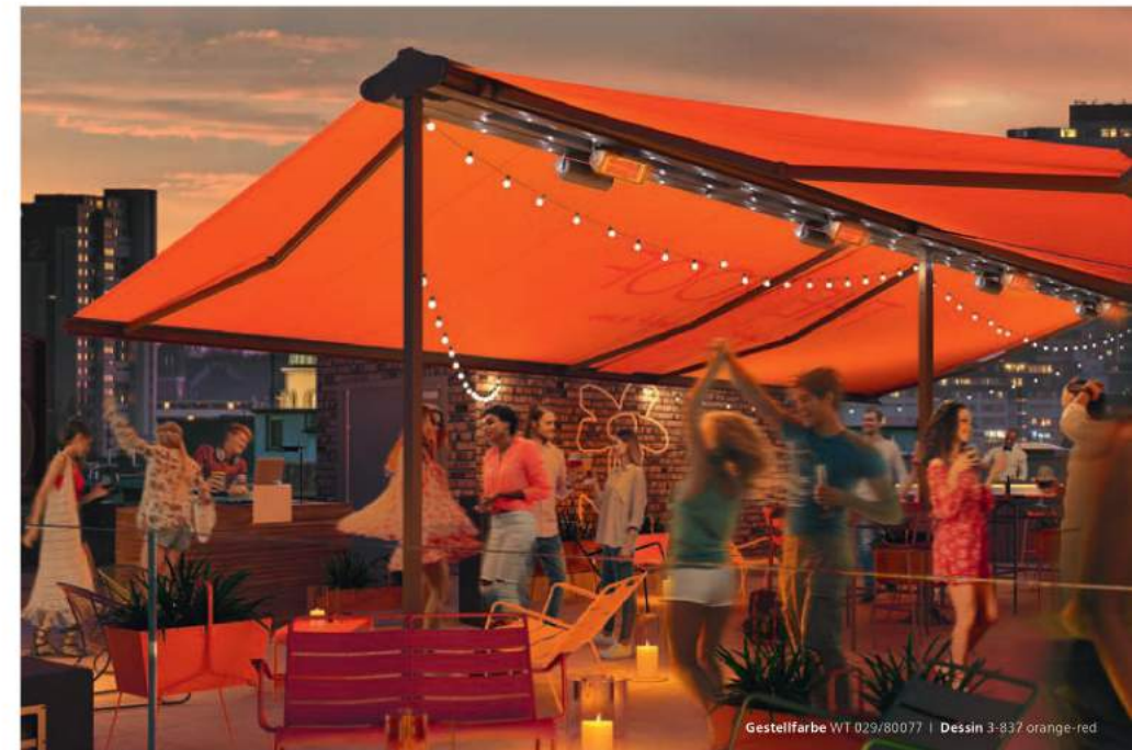
Gestellfarbe WT 029/80077 | Dessin 3-837 orange-red

Duofix eignet sich hervorragend zur Beschattung freier Flächen. Denn zu beiden Seiten der freistehenden Konstruktion sind hochwertige weinor Markisen befestigt. Duofix gibt es in der Ausführung mit den weinor Markisen Opal Design II und Topas sowie der Pergola-Markise Plaza Viva. Auch größere Gesellschaften finden unter dem stabilen und langlebigen Sonnenschutz wohlthuenden Schatten. Die Konstruktion ist bei Bedarf jederzeit wieder problemlos abbaubar.