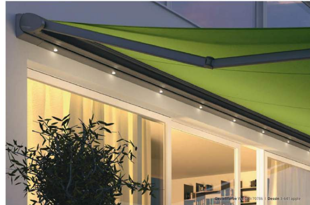
Gestellfarbe WT 029/70786 | Dessin 3-641 apple

Umweltfreundlich, langlebig und kostensparend – hochwertige LED-Spots