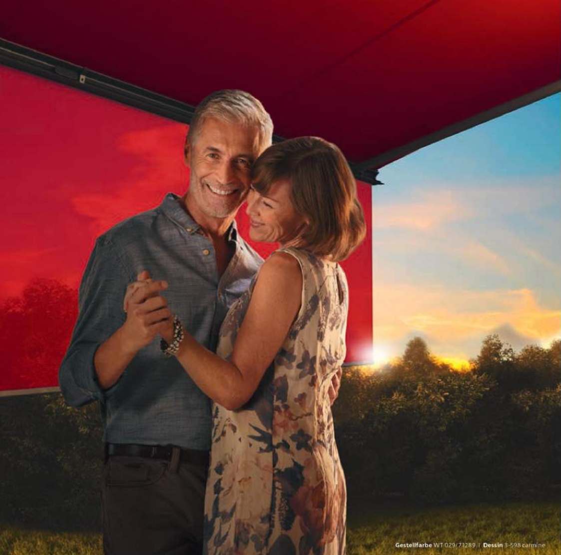
Gestellfarbe WT 029/71289 | Dessin 3-598 carmine