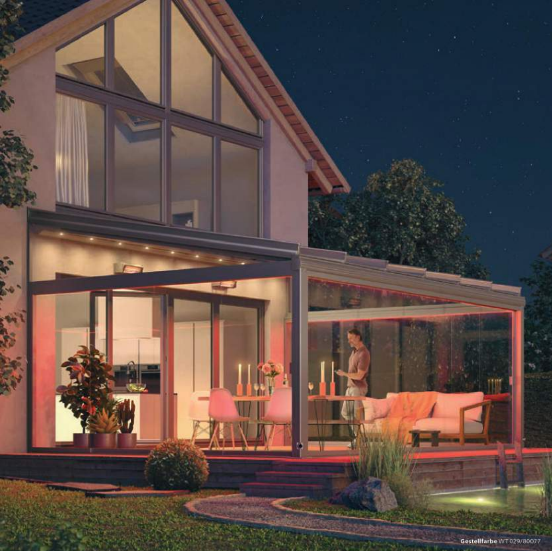
Gestellfarbe WT 029/80077