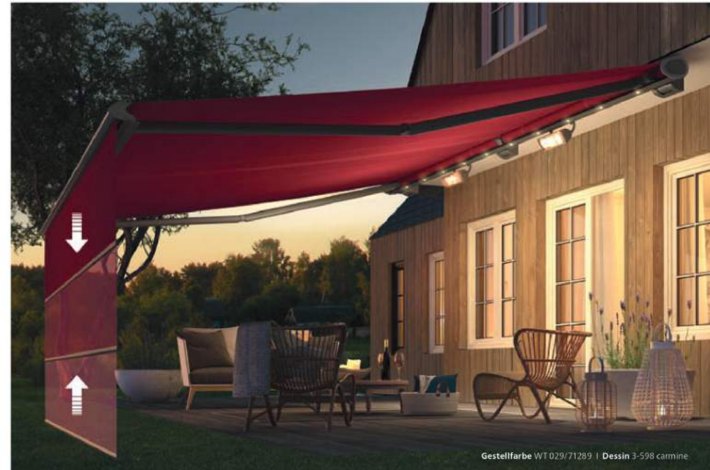
Gestellfarbe WT 029/71289 | Dessin 3-598 carmine

Der Volant Plus von weinor lässt sich optional in das Ausfallprofil integrieren, das den vorderen Abschluss der Markise bildet. Dort integriert er sich elegant in die gesamte Markisenkonstruktion. Die Senkrechtbeschattung lässt sich mit einer Kurbel oder bequem per Knopfdruck steuern – über den gleichen Handsender, mit dem Sie auch Ihre Markise bedienen.