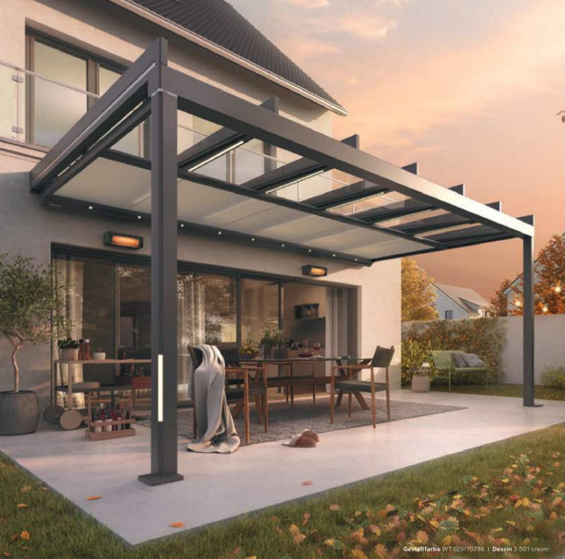
Gestellfarbe WT 029/70786 | Dessin 3-501 cream

Mit der von weinor eingesetzten Infrarot-Technik schonen Sie nicht nur Ihren Geldbeutel. Im Gegensatz zu anderen Heiztechnologien ist die Wärmewirkung auch sofort spürbar.