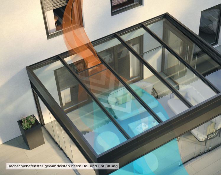
Dachschiebefenster gewährleisten beste Be- und Entlüftung