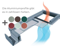
Die Aluminiumprofile gibt es in zahllosen Farben.

Und wenn Sie bereits ein TS-Terrassendach haben: TS-Dachschiebefenster werden individuell angefertigt. Die maximale Größe beträgt auch nachträglich einbauen.