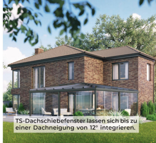
TS-Dachschiebefenster lassen sich bis zu einer Dachneigung von 12° integrieren.