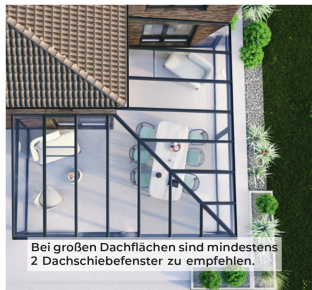
Bei großen Dachflächen sind mindestens 2 Dachschiebefenster zu empfehlen.