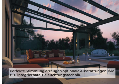
Perfekte Stimmung erzugben optionale Ausstattungen, wie z.B. integrierbare Beleuchtungstechnik.